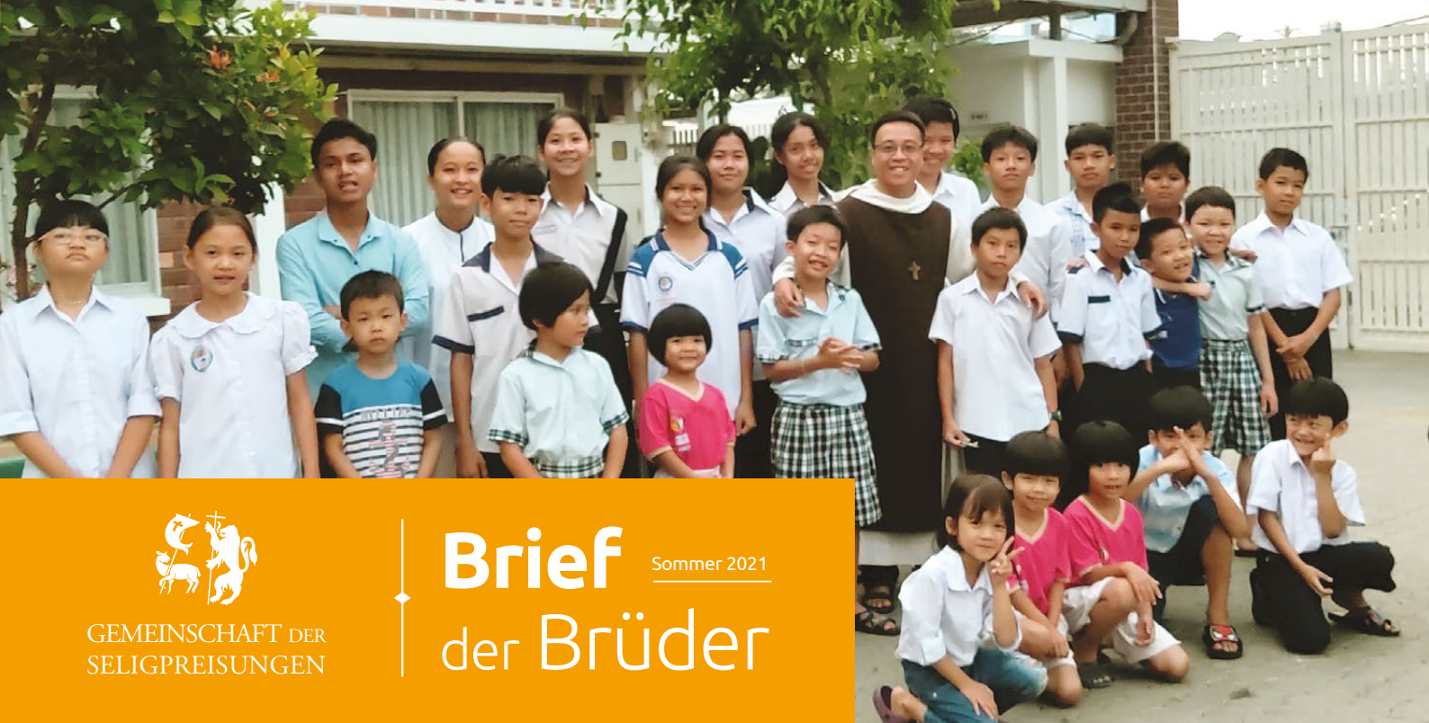
Kinder und Jugendliche des Waisenhauses in Tân Thong, Vietnam.